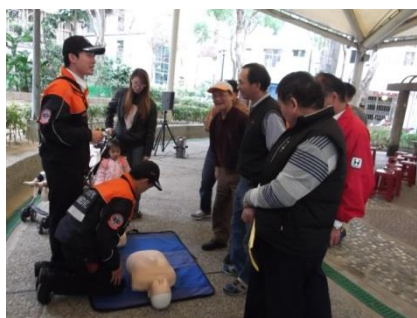
說明：接受接受急救訓練