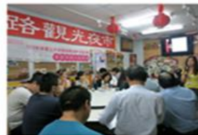
辦理寧夏商圈共識會議與教育訓練