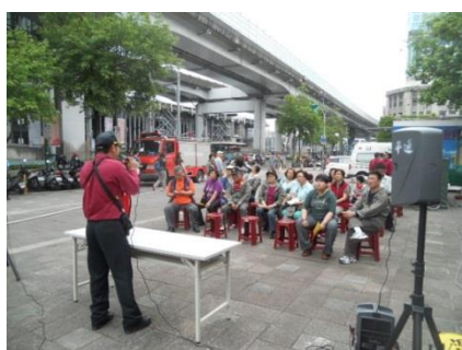
說明：消防隊於後站商圈宣導