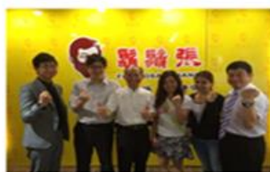
拜訪寧夏商圈重要人物