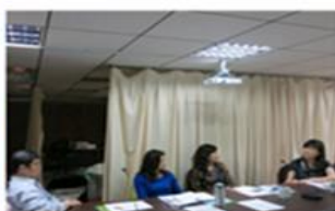
與寧夏夜市觀光協會總幹事及董氏基金會主任洽談