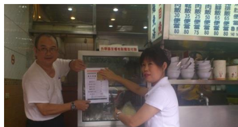
熱量分析資料張貼標章