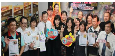
衛生及民政局共同推動安心 ok 標章

(三)健康飲食輔導分析與食材來源登錄：輔導 52 家寧夏商圈攤商做美食熱量分析，推動安心 OK 標章，輔導 109 家攤商做食材來源登錄，不僅全國首創更為全國之冠。