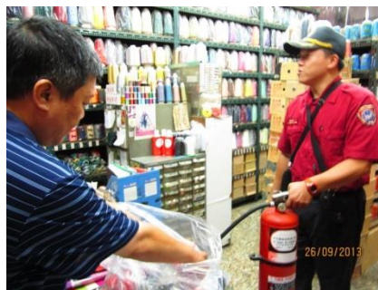
說明：商家接受滅火器查檢