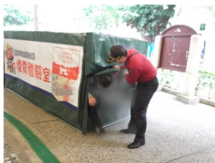
說明：商圈辦理煙霧逃生體驗